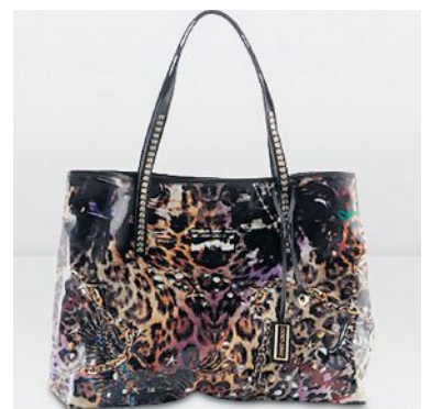
Tasche im Animal-Print von Jimmi Choo.