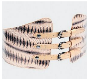
Hüftgürtel im Reptilien-Look von Zara.