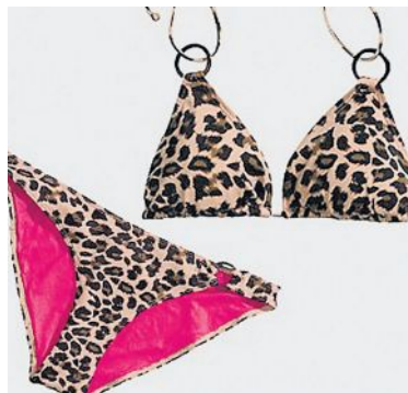
Leoparden-Bikini von H&M.