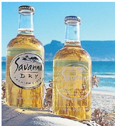
Trendgetränk Savanna Dry von Kapweine.