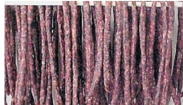
Cooler Snack: Südafrikanische Droewors.