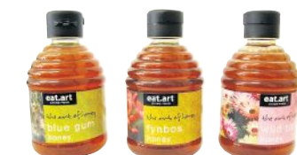
Honig aus südafrikanischen Blüten, erhältlich bei Globus.