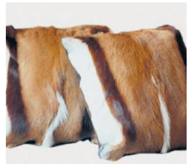
Kissen aus Springbock-Fell von Rufskins.