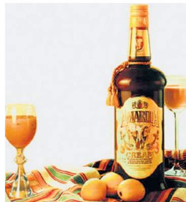
Cremlikör Amarula, im Fachhandel.