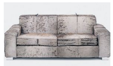
Wildes Lebensgefühl zu Hause: Gnu-Couch.