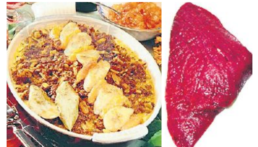
Rindfleischauflauf Bobotie (l). Straussenfleisch.